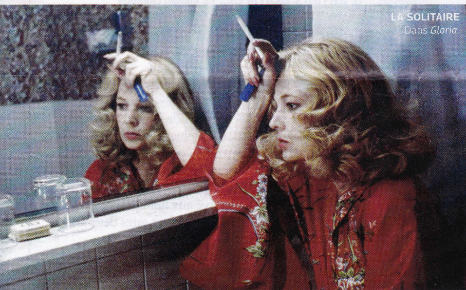
LA SOLITAIRE Dans Gloria .